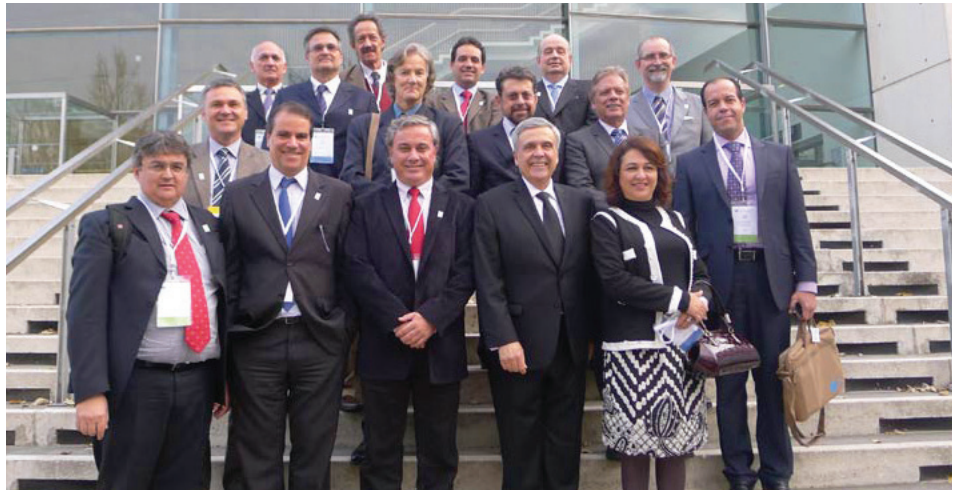
Membros da delegação brasileira do Conselho Mundial da Água

A estrutura é constituída por um grupo de 36 membros governadores,