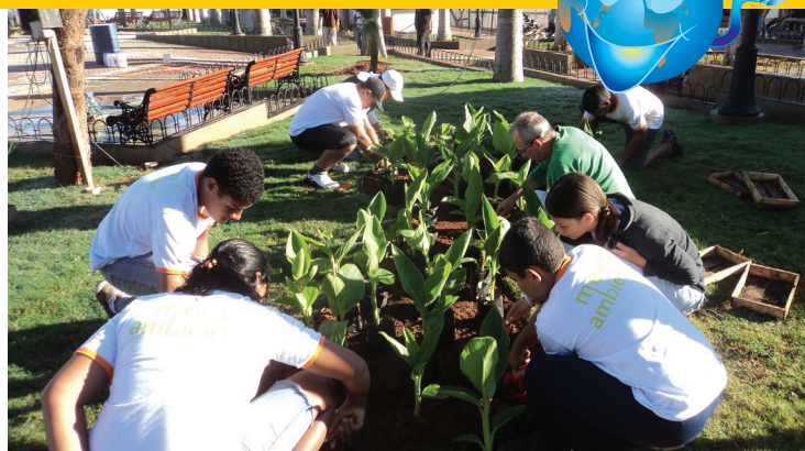
Alunos participaram da composição paisagística da Praça Dr. Gama.