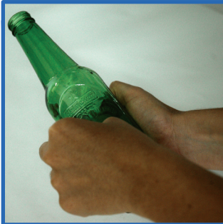
2º passo: Retire as colagens de embalagens que resistiram à lavagem