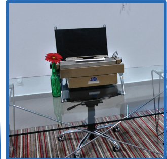
Pronto! Agora seu ambiente tem uma nova peça de decoração.