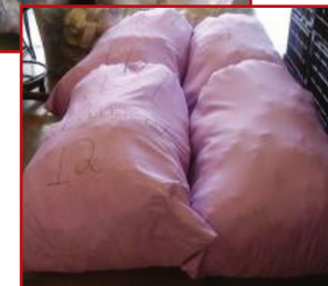
Depois: usam sacolas ecológicas confeccionadas com os restos dos materiais usados na fabricação de calçado.