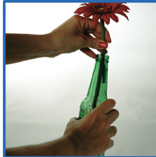
3º passo: Agora é só secar e colocar uma linda gérbera, que pode ser natural ou não