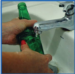
1º passo: Lave a garrafa para retirar os resíduos de bebida