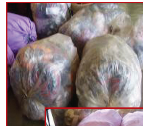
Antes: usavam sacos que não retornavam para a unidade